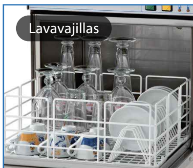
con el SmartSoft